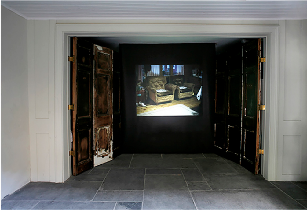
Documentation of Sugar, exhibition Nordig Stories gallery Elastic Residence, London UK 2007