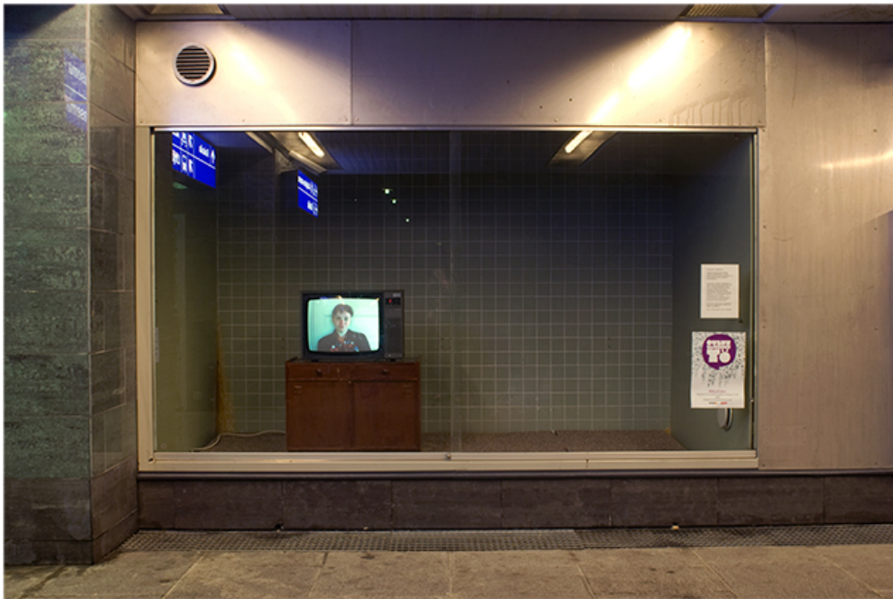
Installation N3, exhibition Encounters, space of Oulun Museum of Art, Finland 2009