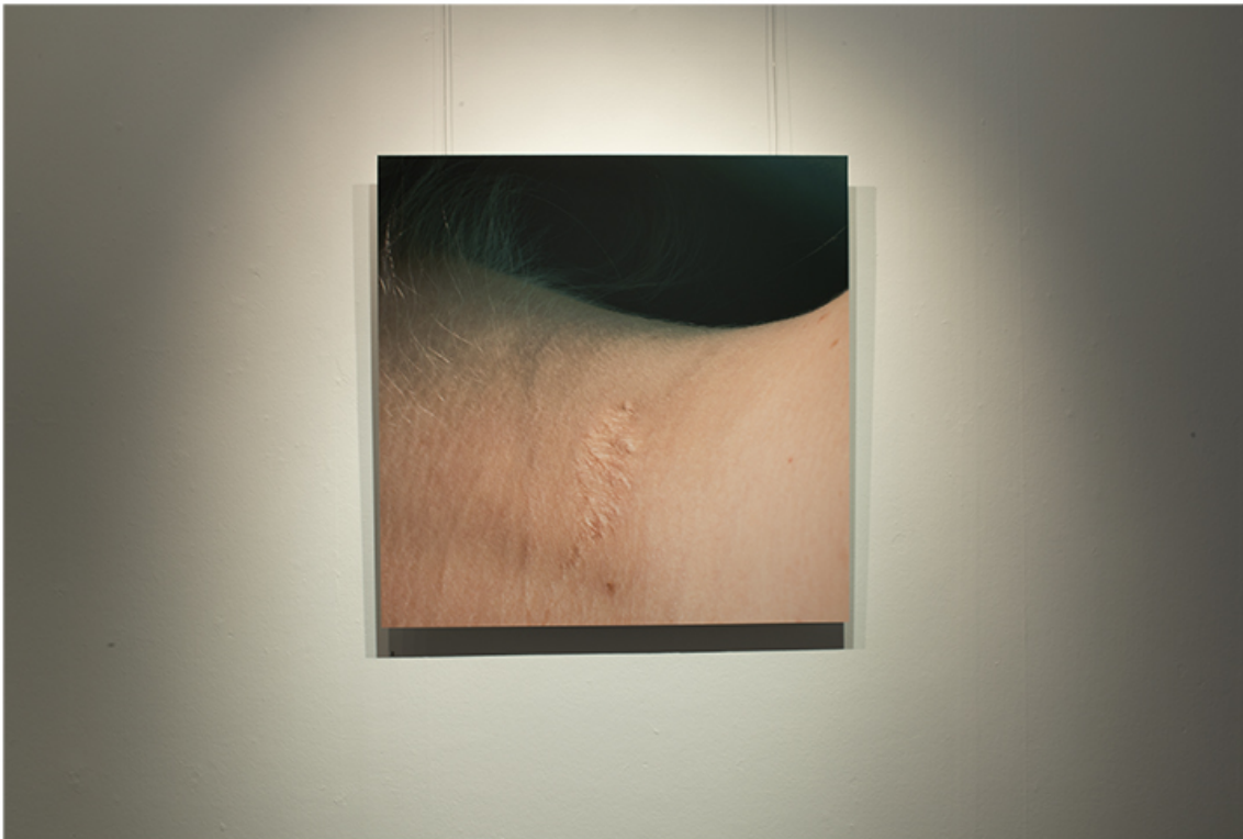
Documentation of the series Solution in the solo show Aftermath. Gallery Saskiat 2014, Finland