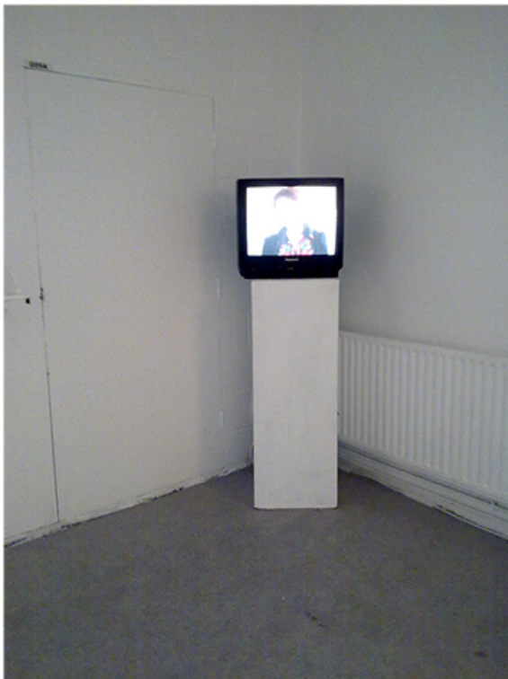
Installation N3 exhibition Bona Fide Genius Concourse Gallery, London, UK 2010 and Museum of Fine Art of the Republic of Karelia, Russia 2012