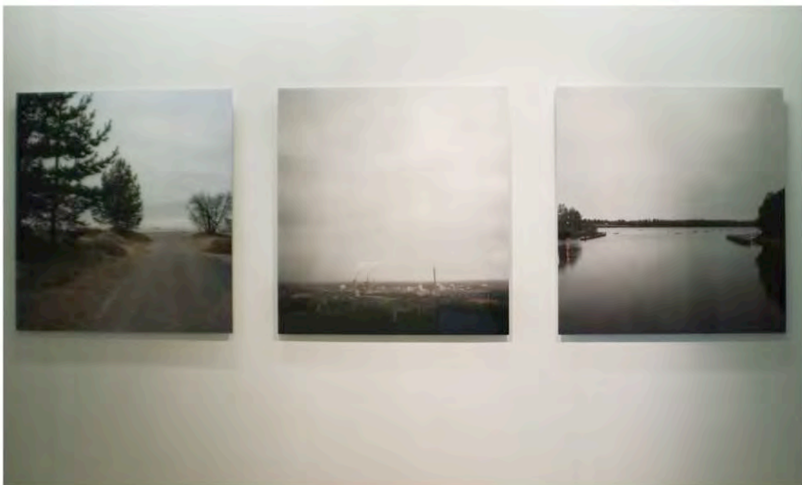
Documentation of the series Oulu XVIII Mänttä Art Festival, City of Dreams 2013