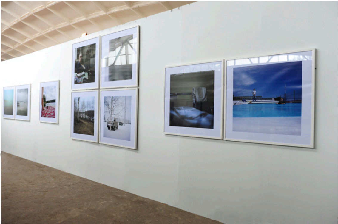
Documentation of the series Memory in Pingyao International Photography Festival 2012, China