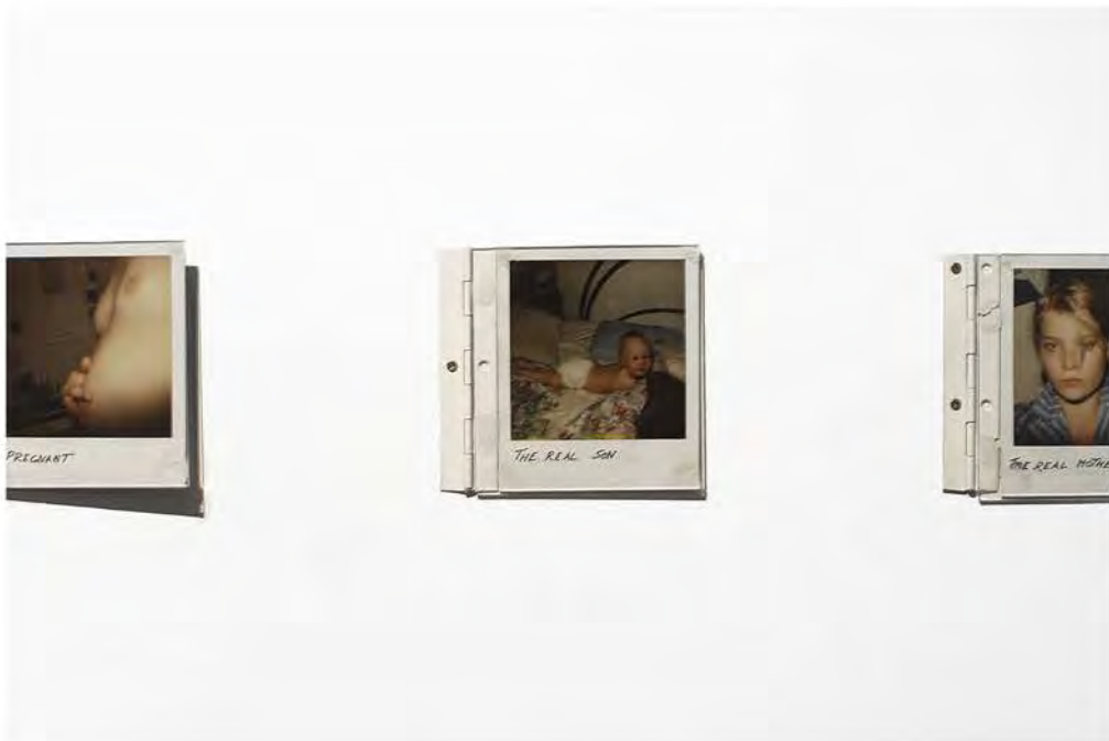
Documentation of an exhibition 'The Role Game and Sugar' in Kummi gallery, Northern Photography Centre (2010)